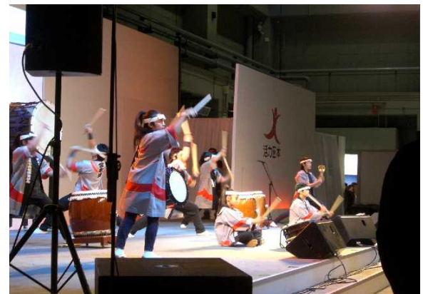
日中両国の政財界人による開会式、内覧会に続き、AKB48コンサート、ファッション食、日本の先進環境技術が紹介され、日本の元気を多くの中国人にアピールしました。